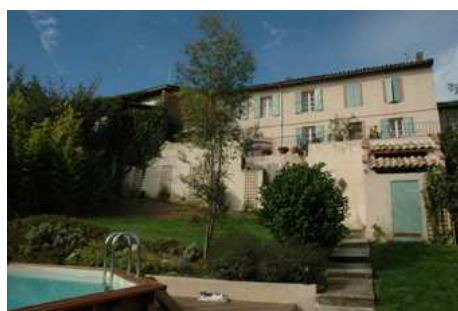
Les chambres d'hôtes et la piscine