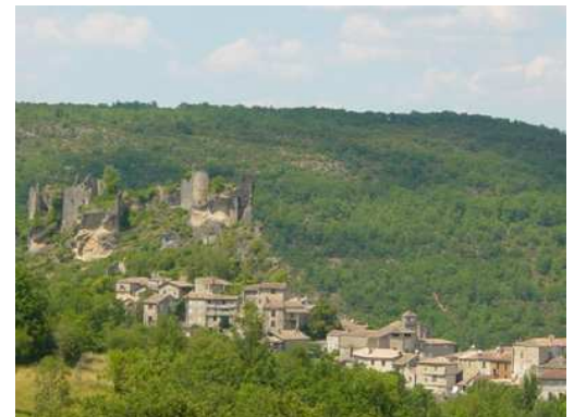
Village de Penne avec son Château haut perché

Les chambres d'hôtes sont dans la rue principale (rue Gérard Roques) en montant sur la gauche (façade ocre et volets verts).