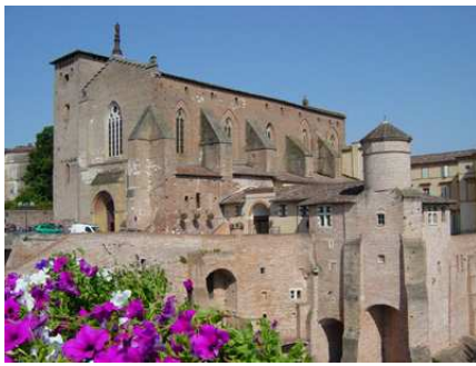
Gaillac : l'Abbaye St Michel abritant le Musée de la Vigne et du Vin