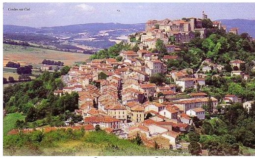
Cordes sur Ciel