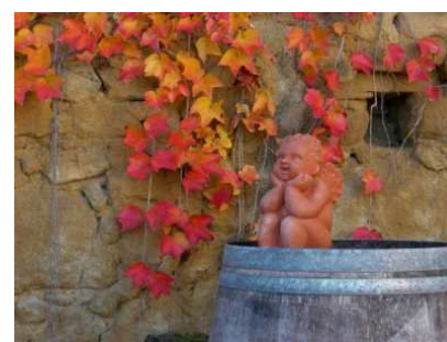
L'ange gardien de la maison !